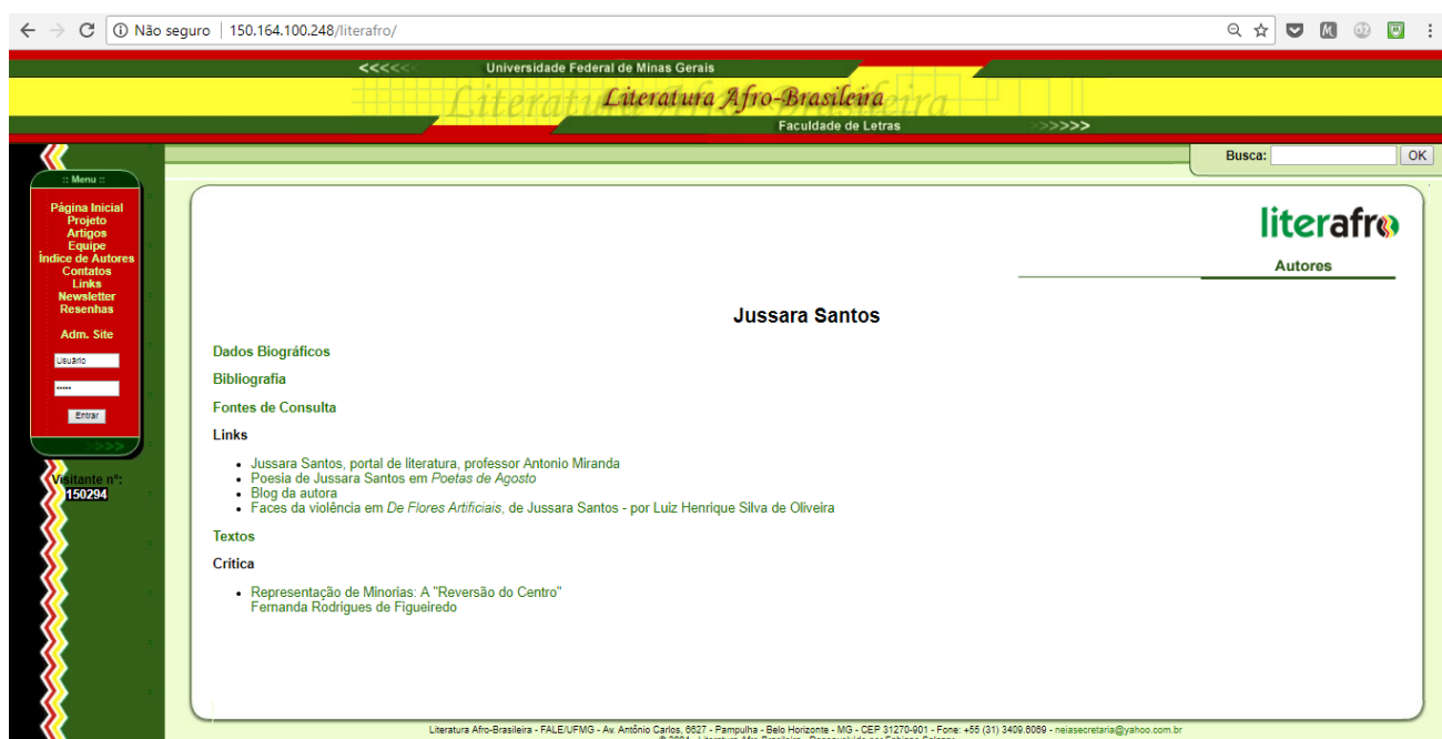
Figura 3 - Menu de um autor no Portal Literafró

A escolha pelo Portal se dá tanto pela confiabilidade dos dados, quanto pela proximidade teórica que norteou o levantamento de dados e sua organização com aquela adotada na elaboração deste trabalho. Cabe ressaltar, ainda, a importância do Portal, um dos