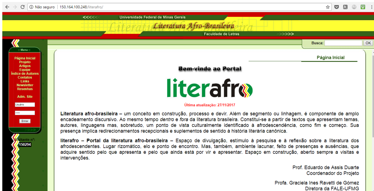
Figura 1 - Página Inicial do Portal Literafro

O Portal exhibe, no menu de autores, a listagem de 125 autores com alguma regularidade de publicações e cujas publicações contemplem os elementos estabelecidos por Duarte (2015) – temática, autoria, ponto de vista enunciativo, linguagem e público – responsáveis por constituir a unidade da literatura afro-brasileira, enquanto um dos “subsistemas” (Even-Zohar, 2013) da literatura brasileira. Algumas das informações apresentadas acerca dos autores listados são: informações biográficas, em geral exibidas com fotos ou ilustrações; dados bibliográficos; textos críticos e teóricos além da indicação de locais; e fontes de pesquisa, conforme imagens anexas.